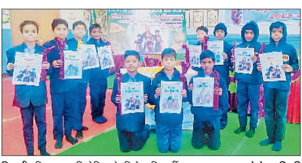
भिवानी। चित्रकला प्रतियोगिता के विजेता विद्यार्थी।