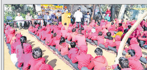
हेप्पी विद्यालय में वीर बाल दिवस पर कार्यक्रम