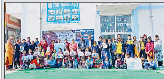
बच्चों ने साहिबजादों को दी श्रद्धांजलि