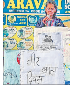
महेंद्रगढ़। कार्यक्रम में अपनी प्रस्तुति देती छात्रा।