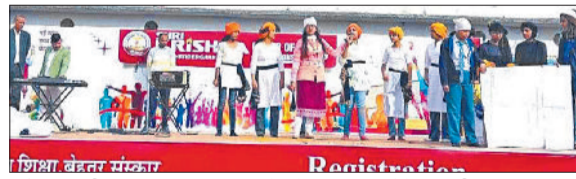
श्रीकृष्णा स्कूल में श्रद्धा के साथ मनाया वीर बाल दिवस, बच्चों ने किया भावविमोर्

महेंद्रगढ़। श्रीकृष्णा स्कूल में वीर बाल दिवस श्रद्धा और देशभक्ति के भाव के साथ मनाया गया। यह दिवस सिखों के दसवें गुरु गुरु गोबिंद सिंह के छोटे साहिबजादे साहिबजादा, जोरवार सिंह एवं साहिबजादा फतेह सिंह के अद्वितीय बलिदान की स्मृति में मनाया जाता है। कार्यक्रम का उद्देश्य विद्यार्थियों में साहस, त्याग और धर्म के प्रति अटूट आस्था के मूल्यों को जगृत करना रहा। कार्यक्रम की शुरुआत प्राथमिक सभा के साथ हुई। इस दौरान शिक्षक ने वीर बाल दिवस के ऐतिहासिक महत्त्व पर प्रकाश डालते हुए साहिबजादों की वीरता, साहस और अन्याय के सामने न झुकने के दृढ़ संकल्प के बारे में विस्तार से बताया। कार्यक्रम के दौरान विद्यार्थियों ने भाषण, कविता पाठ एवं विचार प्रस्तुत कर साहिबजादों को श्रद्धांजलि अर्पित की। कुछ विद्यार्थियों ने साहिबजादों के जीवन से जुड़े प्रेरक प्रसंग साझा करते हुए बताया कि किस प्रकार छोटी आयु में भी उन्होंने धर्म और जय की रक्षा के लिए सर्वोच्च बलिदान दिया। इन प्रस्तुतियों ने उपस्थित सभी शिक्षकों व विद्यार्थियों को भावविमोर् कर दिया।