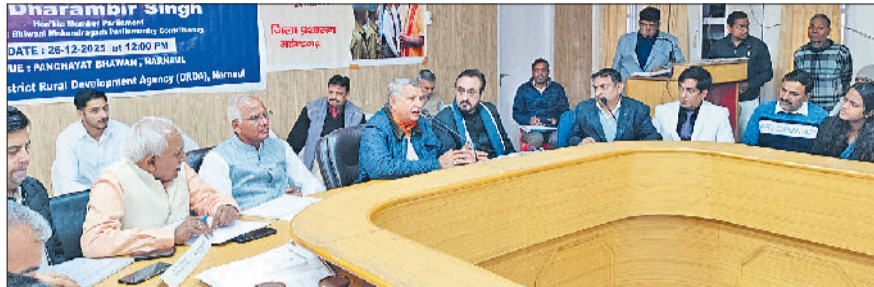
नारनौल। दिशा की बैठक लेते सांसद चौधरी धर्मबीर सिंह।

2047 तक विकसित भारत के सपने को पूरा करने में अहम भूमिका निभाएगी वीबी जीरामजी : चौधरी धर्मबीर सिंह हरिभूमि न्यूज़ | नारनौल