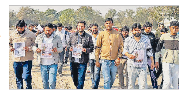
भिवानी। काली पट्टी बांधकर विरोध प्रदर्शन करते युवा कांग्रेस कार्यकर्ता।

उन्नाव दुष्कर्म मामले के मुख्य आरोपी एवं पूर्व भाजपा विधायक कुलदीप सिंह सेंगर को दिल्ली हाई कोर्ट से मिली जमानत के खिलाफ प्रदेशभर में आक्रोश देखने को मिल रहा है। इसी कड़ी में शुक्रवार को भिवानी में हरियाणा युवा कांग्रेस के कार्यकर्ताओं ने सड़कों पर उतरकर जोरदार प्रदर्शन किया। युवा कांग्रेस के प्रदेश उपाध्यक्ष